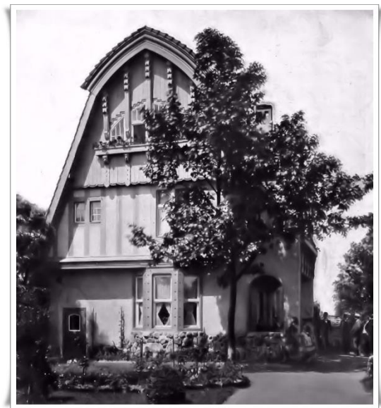
1906: Haus Möhring in der Parallelstraße; Gartenseite